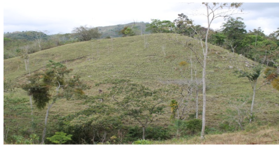
Figuras 2 y 3 Zonas deforestadas en la parte media de la Sub - cuenca de Yaoska.

Ante esta situación, el Ministerio del Ambiente y Recursos Naturales (MARENA) 11 , la Alcaldía, el Instituto Nacional Forestal (INAFOR), el Ministerio de Educación (MINED), ADDAC, ADIC, la Sociedad civil y los ciudadanos del municipio a través de distintas iniciativas, conjuntas o separadas, han organizado brigadas comunitarias para la prevención y control de incendios, para establecer viveros comunales para la producción de plantas, para reforestar las nacientes y riberas de los ríos, establecer plantaciones compactas comunales para leña, fomentar el uso de cocinas mejoradas, realizar campañas de divulgación, a través de la radio, medios escritos locales y bandas municipales, sobre las normas, decretos, leyes y ordenanzas ambientales, desarrollar campañas radiales sobre efectos de los incendios, protección de las fuentes de agua y de la fauna silvestre y acuática, incrementar el saneamiento para proteger las fuentes hídricas.